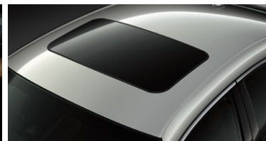
TECHO SOLAR ELÉCTRICO