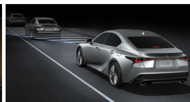
CONTROL DE VELOCIDAD CRUCERO ADAPTATIVO