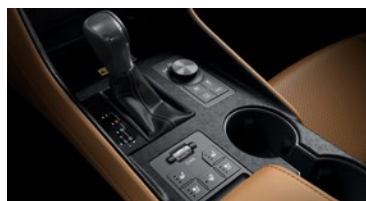
ASIENTOS DELANTEROS VENTILADOS Y CALEFACCIONADOS