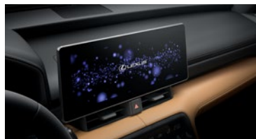
PANTALLA DE 12,3" Y AUDIO MARK LEVINSON CON 17 PARLANTES