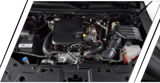
MOTOR MULTIJET 2.2TD