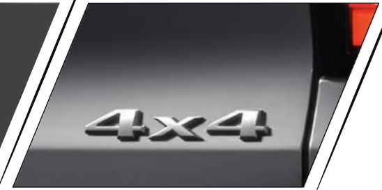
TR ACCIÓN FWD,AWD & 4WD LOW