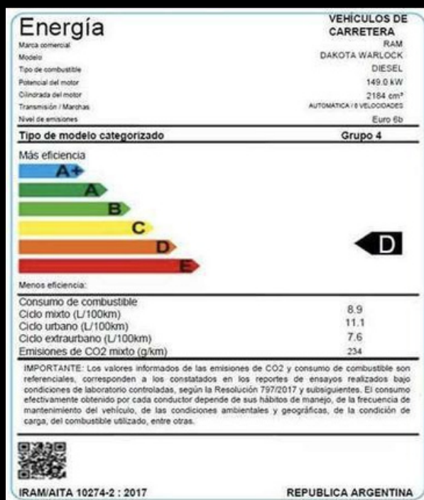
DAKOTA LARAMIE 2.2TD AT8 4X4