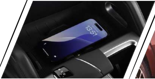
SISTEMA RAM CHARGER®