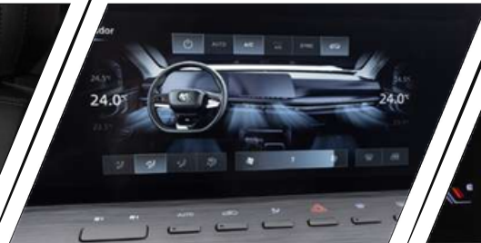
CENTRAL MULTIMEDIA 12,3"